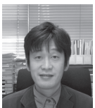
野呂 文行 教授 人間総合科学研究科 障害科学専攻