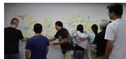
皆のアイデアを書いた付箋紙をまとめ、アンカンファレンスのセッションを組み立てます。

通常のカンファレンスと違って事前設定したテーマがありません。代わりに、参加者が自分の話したいアイデアを出し合い、近いものをまとめることでセッションを組んで議論します。自分ならではのアイデアを他の参加者とかけ合わせることで、誰もが主人公となり、熱い議論と多様な人とのつながりが生まれます。