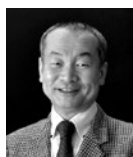
原島恒夫 教授 人間総合科学研究科 障害科学専攻