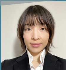
筑波大学バドミントン部コーチ AKUA BADMINTON コーチ